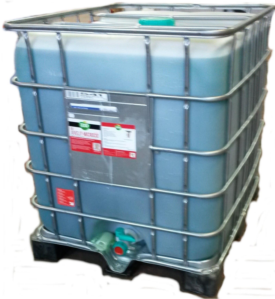
Juvelit-protect 1000L IBC art.no. 84304